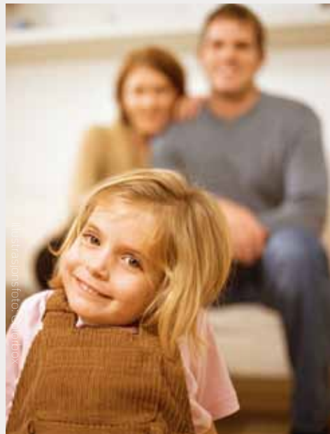
TRENGER VEILEDNING: Mange ønsker hjelp til å snakke med barnet om sin egen sykdom.

Gjenkjennelse i informasjon om Barnas Time, at personalet bruker et forståelig språk og frivillighet, fremheves som viktig for valget om å delta. Pasientundervisning er en viktig arena for gjenkjennelse og erkjennelse. Pasientundervisning bør derfor vurderes innført også i poliklinikk. Faglig tyngde hos de som informerte, og opplevelse av ryddighet i tilbudet ble sagt å ha betydning. Redsel for barnevernets innblan-