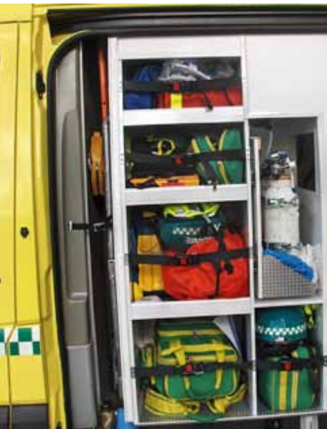
LÅST FRA UTSIDEN: Alt utstyret er plassert i et rom som kun kan nås fra utsiden av ambulansen.