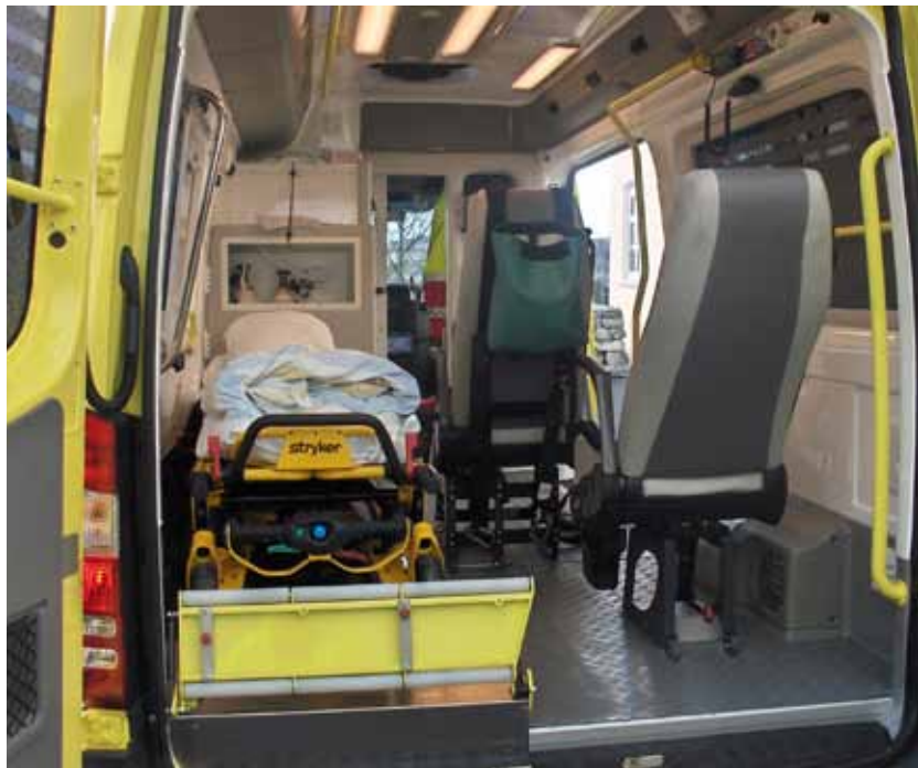
STØRRE ENN VANLIG: Ambulansen har litt bedre plass innvendig enn vanlige ambulanser.